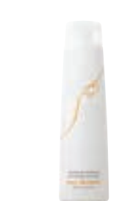
クー ボディシャンプー (350ml) 1,800円 (税抜)