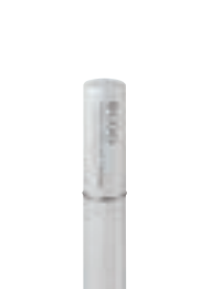
薬用クーリップクリーム 3,000円 (税抜) 医薬部外品