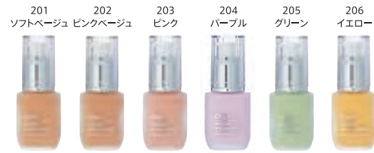
クー ウォーターファンデーション (各30ml) 各3,500円 (税抜)