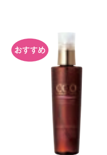
クー 薬用 スカルプローション (180ml) 5,000円 (税抜) 医薬部外品