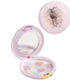
クー エレガンス ルーセントパウダー 全4色 5,000円 (税抜) レフィル 4,000円 (税抜)