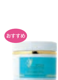
YFスキンエクセレント タラソパック (200g) 15,000円 (税抜)