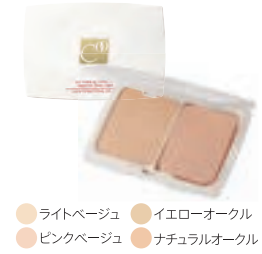
クー エレガンス 2ウェイクキー(SPF15 PA+) 全4色 各4,600円 (税抜) レフィル 各3,600円 (税抜)