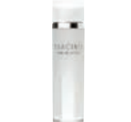
プレミアムローション (120ml) 22,000円 (税抜)