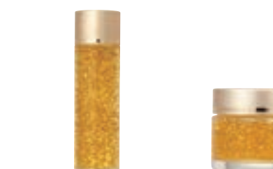
YF ゴールドローション (150ml) 6,000円 (税抜)