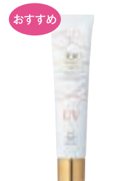
クー デイプロテクション UVクリーム (40g) 4,000円 (税抜) SPF50+ PA+++