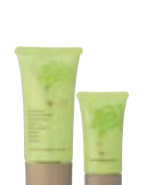
クー・モイストハンド トリートメント 2本セット (70g+30g) 4,000円 (税抜)