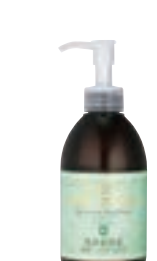
薬用ディープ クリーンジェル (250ml) 1,715円 (税抜) 指定医薬部外品