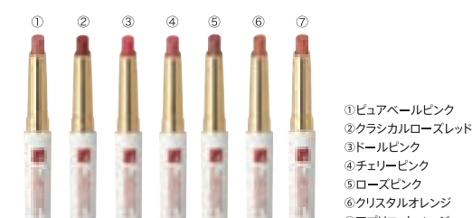
クー エレガンス リップスティック 全7色 各3,000円 (税抜)