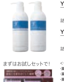
YFエクセレントマイルドシャンプー (600ml) 4,600円 (税抜) 詰替え用(500ml) 3,600円 (税抜)