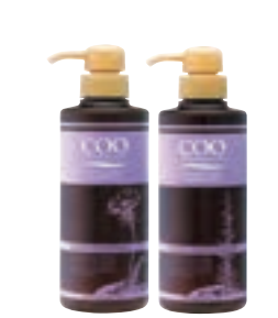
クー 薬用スカルプ シャンプー・コンディショナー 各(400ml) 各3,800円 (税抜) 医薬部外品