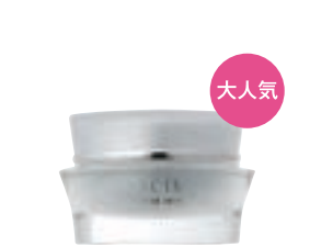
プレミアムクリーム (34g) 60,000円 (税抜) 医薬部外品