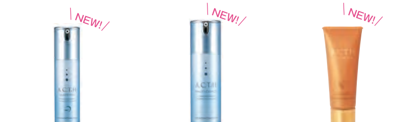
ビューティーアイズ (15ml) 12,000円 (税抜)

目元に豊かなハリと深い 潤いを ピンとハリ、プルと弾力 乾燥し血行が悪くなった肌を やさしく包む