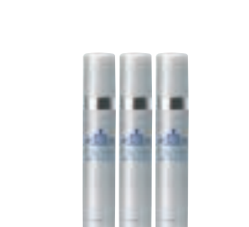
ナイトハーブエッセンス (10ml×3本) 30,000円 (税抜)