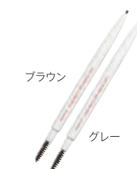
クー エレガンス プロウライナー 全2色 各2,000円 (税抜)