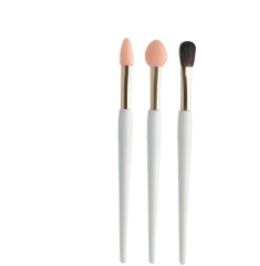
クー エレガンス アイカラーブラシ(ケースつき) 3本セット 600円 (税抜)