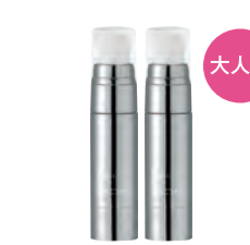
アイリンクルマジック (10g×1本) 10,000円 (税抜) (10g×2本) 18,000円 (税抜)