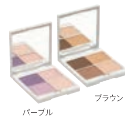
クー エレガンス アイカラー 全2色 各3,400円 (税抜)