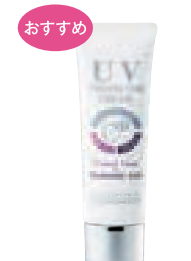
クー UVプロテクター クリーム (50g) 5,000円 (税抜) SPF35 PA++